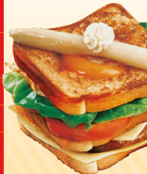
Sándwich GASTHOF Classic