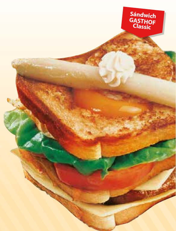
Sándwich GASTHOF Classic